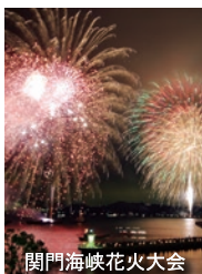
関門海峡花火大会

昭和63(1988)年、下関の活性化と発展を願い、地元住民・企業・行政等が出資し設立。行動するシンクタンクとして「小さな世界都市下関」を目指し、『ウォーターフロント開発』や『沖合人工島』など各種の提言や事業を実践。現在『関門海峡花火大会』をはじめ、『海峡花通り～下関花いっぱい計画』や『しものせき誇り100選』、『文化サロン』などを通じて、海峡都市下関の醸成に資する各種活動を展開しています。