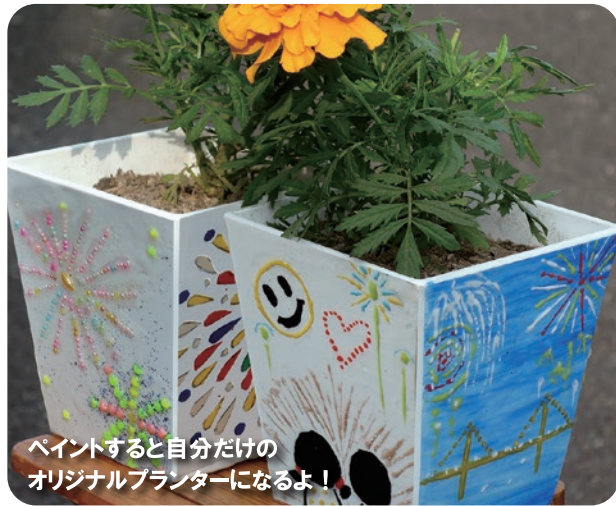
ペイントすると自分だけのオリジナルプランターになるよ！