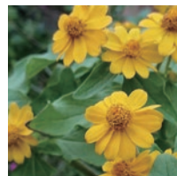
メランボジューム