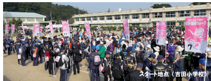
スタート地点 (吉田小学校)